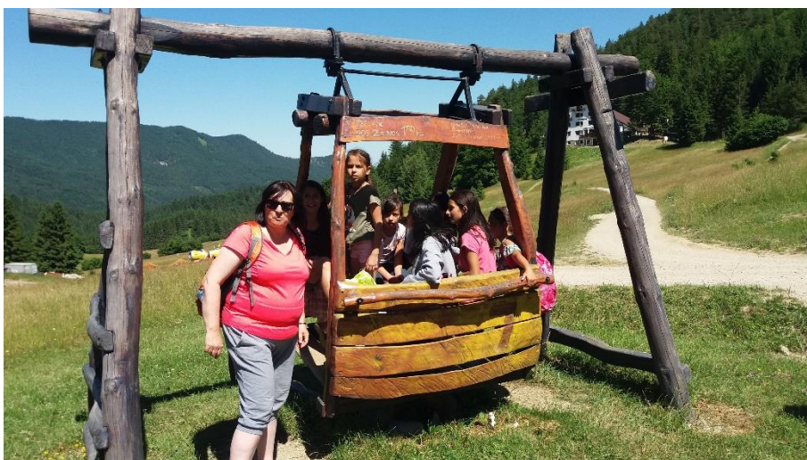
Výlet na Malinô Brdo