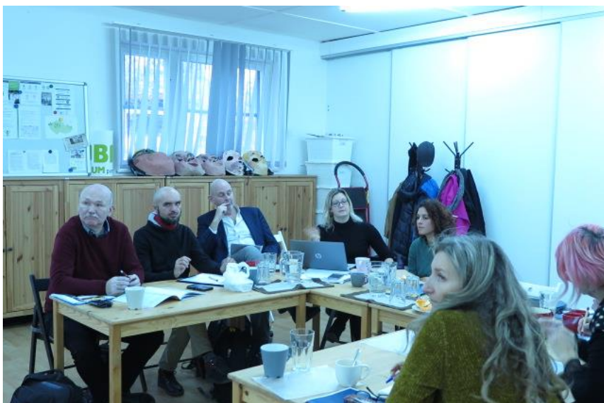
Prvé stretnutie v rámci nadnárodného projektu Spoločne za systémové zmeny v trestnej justícii v Prahe