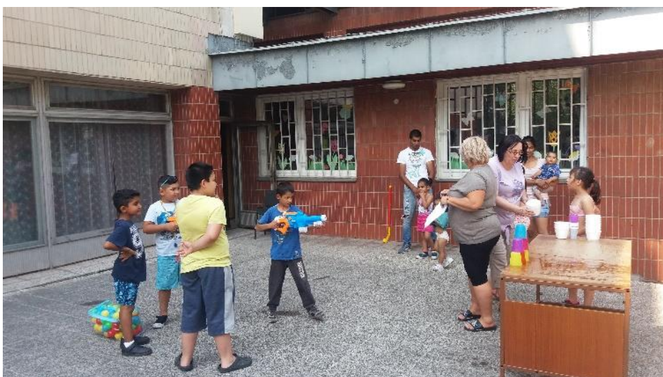
Letné športové hry pre deti zo sociálne slabšieho prostredia