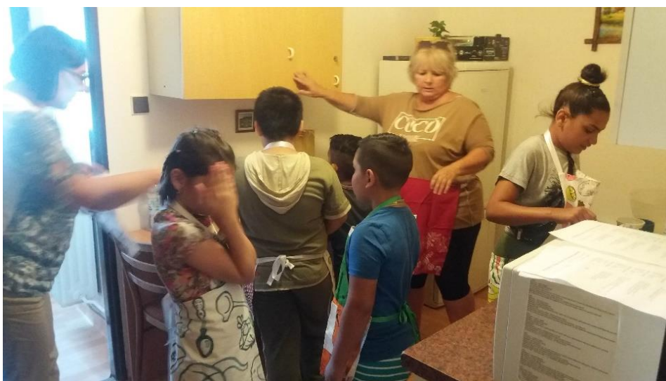
Pečenie lievancov v komunitnom centre