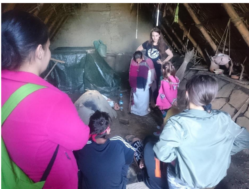
Výlet do pravekej osady Mokrý kút