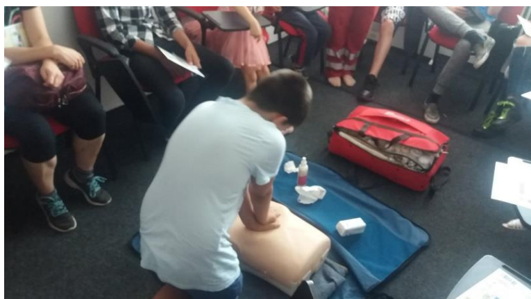
Kurz prvej pomoci