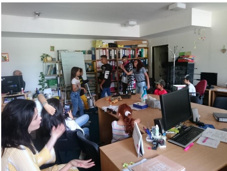
Rap a Beatbox battle