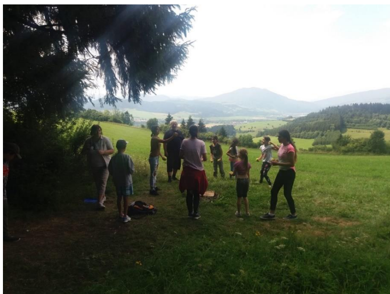
Opekačka na Trninách